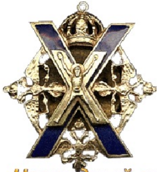
Нагрудный знак Лейб- гвардии Преображенског о полка