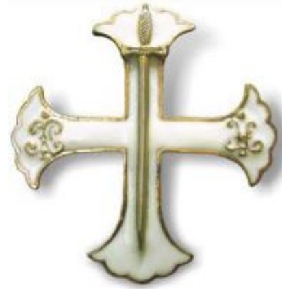
Нагрудный знак Лейб- гвардии Семеновского полка

Из этих потешных полков при Петре I были созданы первые гвардейские полки - Преображенский и Семеновский. Своё боевое крещение они получили в сражениях Северной войны. В 1707 году оба полка стали конными.