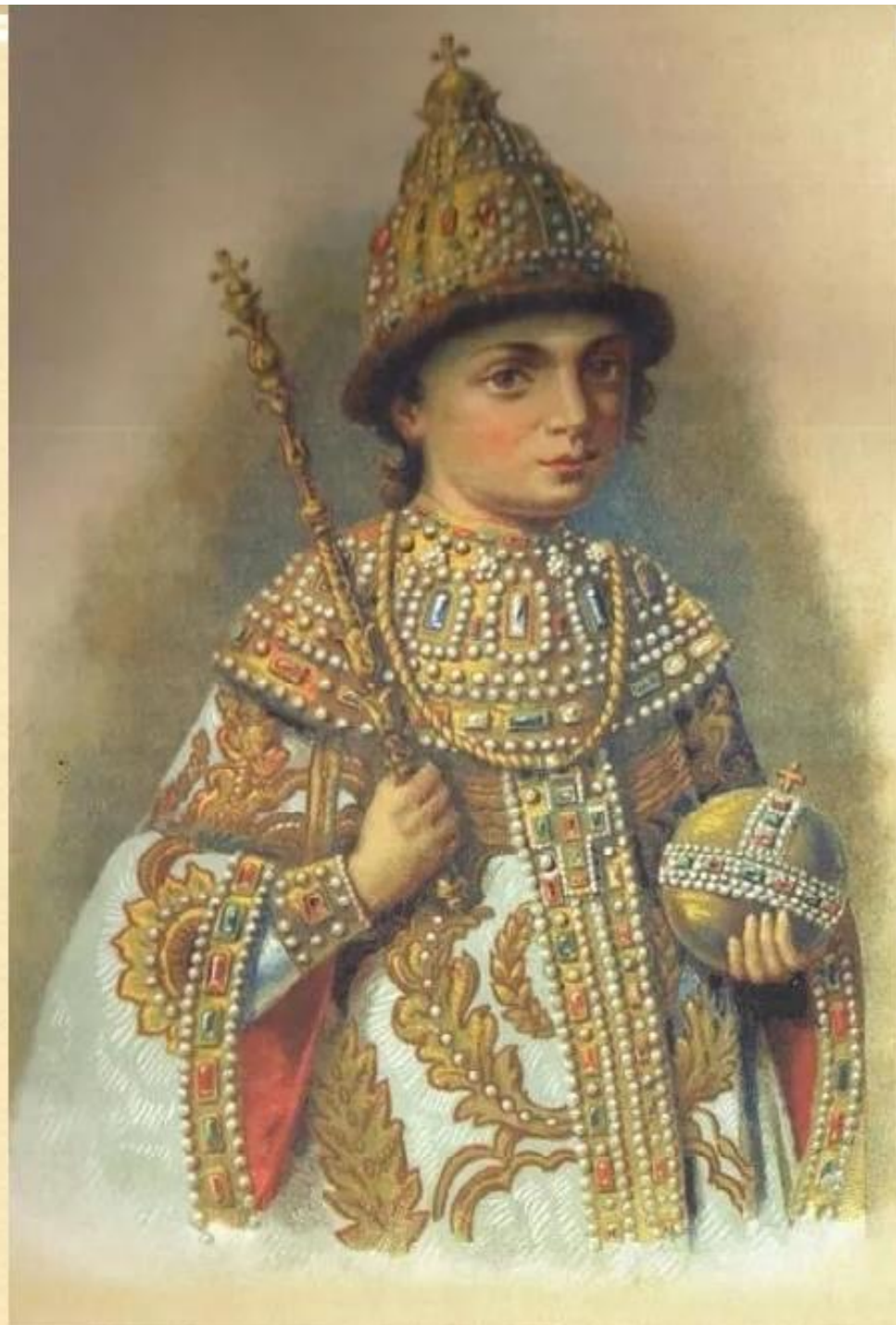
Петр I в детстве